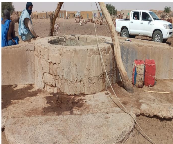
Margelle avec des cloques et des décollements d'enduits