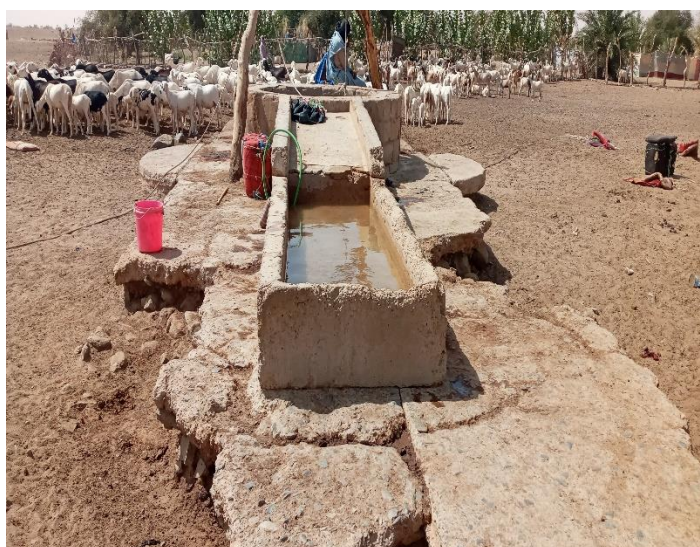
Abreuvoir en bon état / Dalle anti-bourbier cassée et fissurée