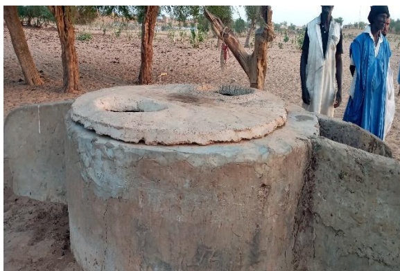
Puits à réhabiliter fermé