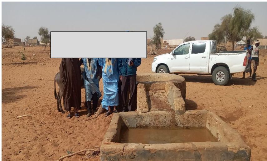
Aperçu du puits à réhabiliter