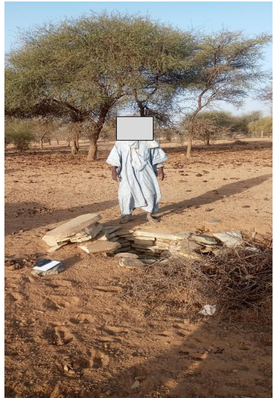
Aperçu du puits à réhabiliter