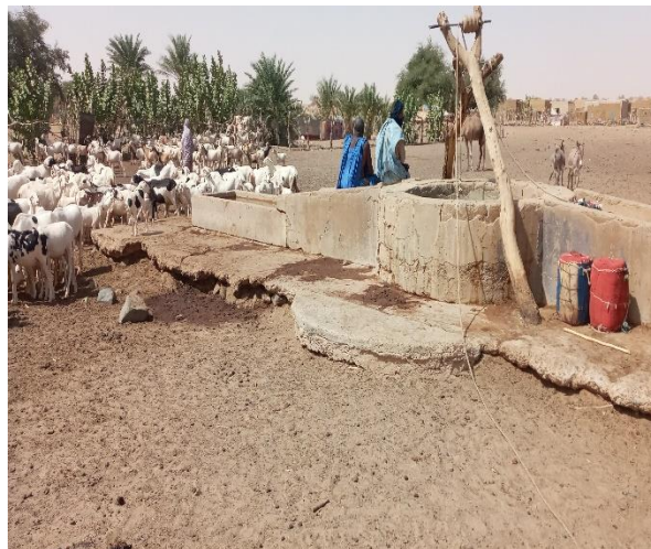
Bon état du béton mais absence partielle de remblai sous la dalle anti-bourbier