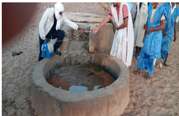
Un des abreuvoirs du puits