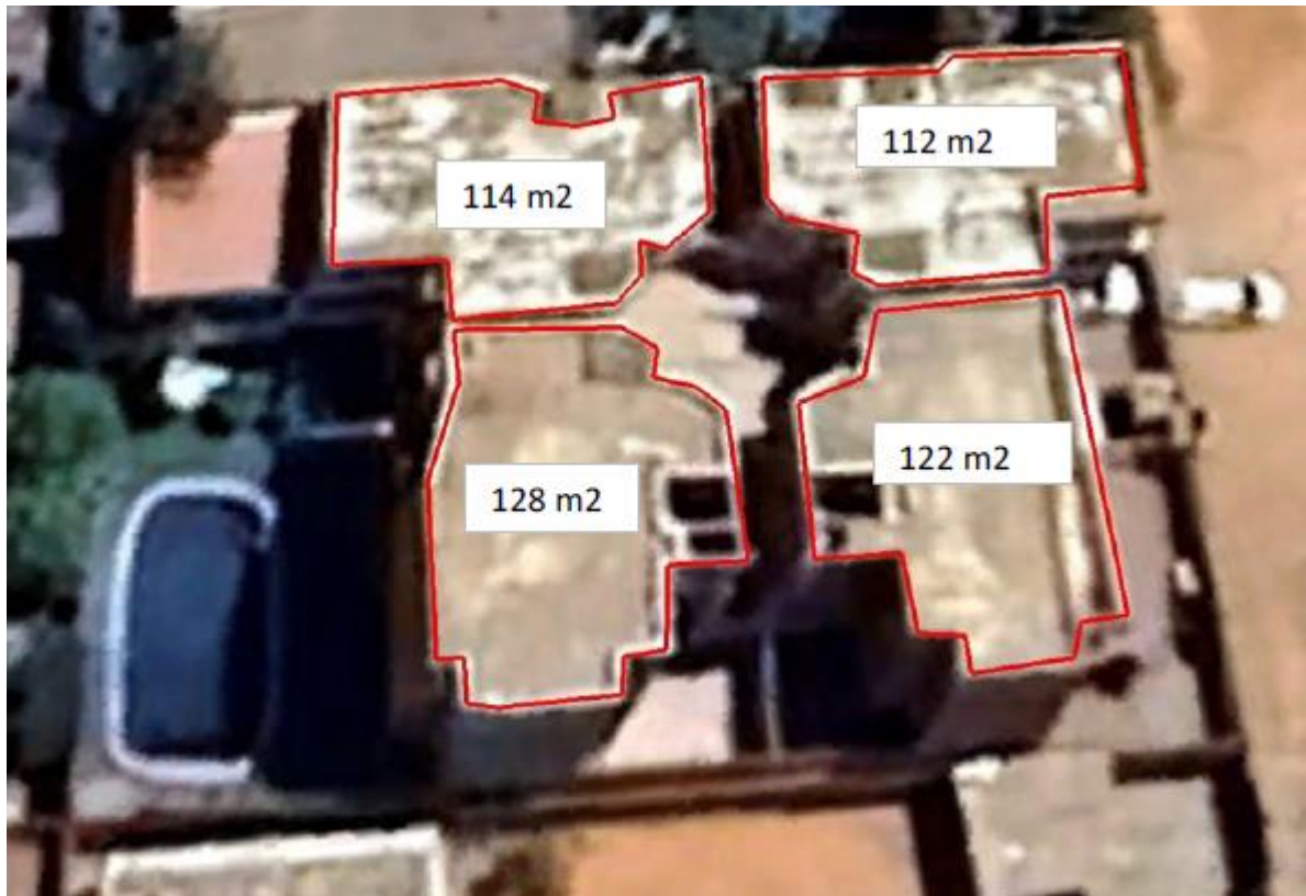
Toits des blocs du bâtiment

Le calcul du potentiel solaire du toit des bâtiments de 487 m 2 montre qu'il est possible d'installer un nombre suffisant de panneaux qui pourraient produire l'ensemble du besoin énergétique à la Représentation.