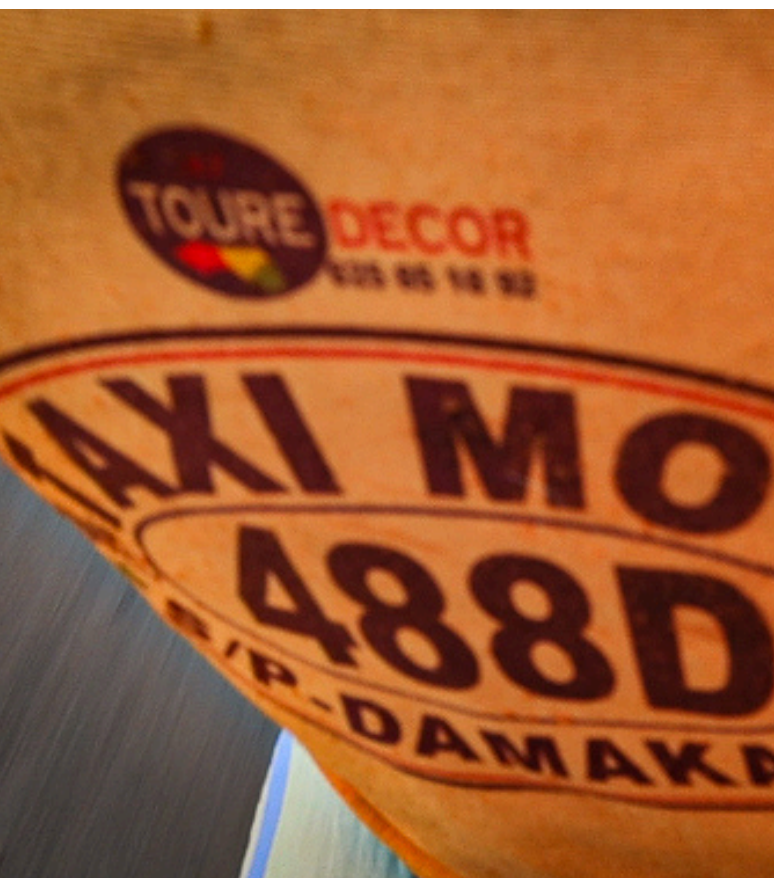
Chaque taxi maître en Guinée possède son gilet qui permet de l'identifier et de rassurer les clients.