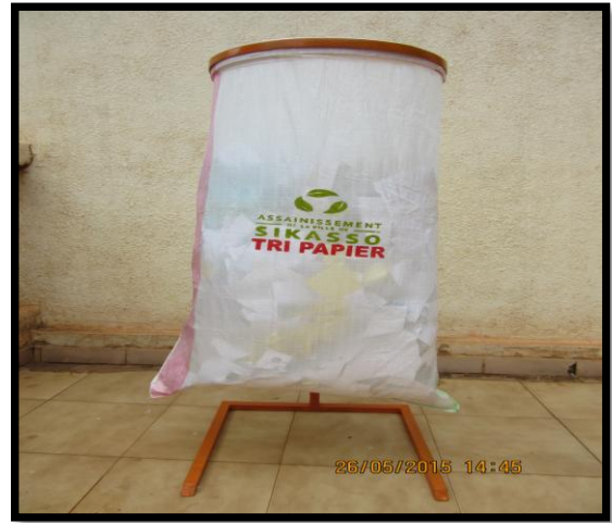
Figures 2, 3, 4 et 5 : papiers en vrac, poubelle spécifique pour la collecte sélective, machine de moulage et modèle de plateau